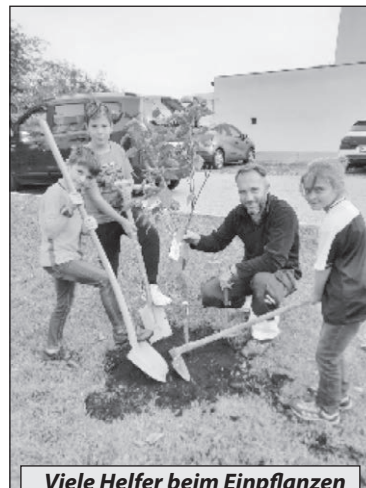
Viele Helfer beim Einpflanzen

Im Sommer nahmen die Marktgemeinde Wimpassing und die Volksschule am Gewinnspiel „Klimafreundliche Bäume für SMARTIE's!“ der gemdat noe teil.