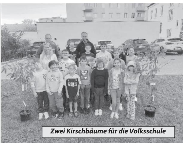
Zwei Kirschbäume für die Volksschule

Im Sommer nahmen die Marktgemeinde Wimpassing und die Volksschule am Gewinnspiel „Klimafreundliche Bäume für SMARTIE's!“ der gemdat noe teil.