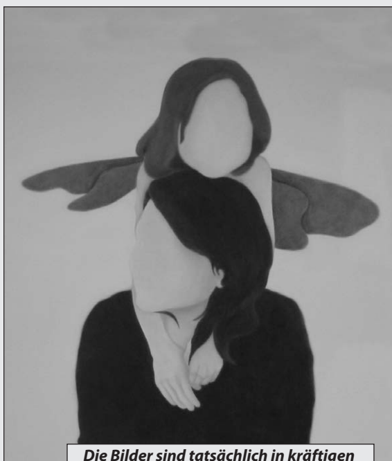
Die Bilder sind tatsächlich in kräftigen Farben auf die Leinwände gemalt!